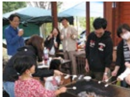
レクリエーション(バーベキュー)