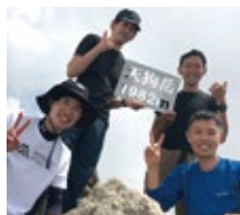
部活動(アウトドア部)