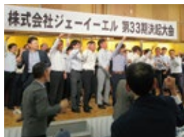
レクリエーション(決起集会)