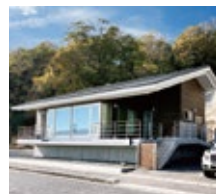
保養所3(尾道市向島)