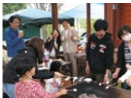
レクリエーション(バーベキュー)