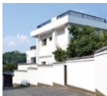
保養所1(尾道市向島)