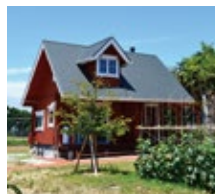
保養所2(尾道市向島)